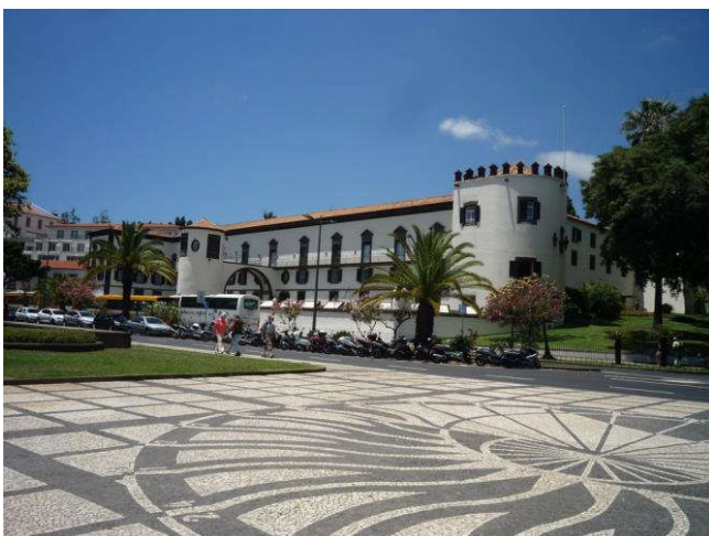
Le palais du gouverneur à Funchal