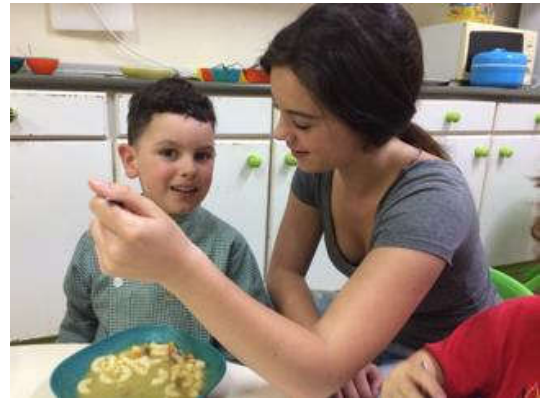
Chloé aide un enfant à manger