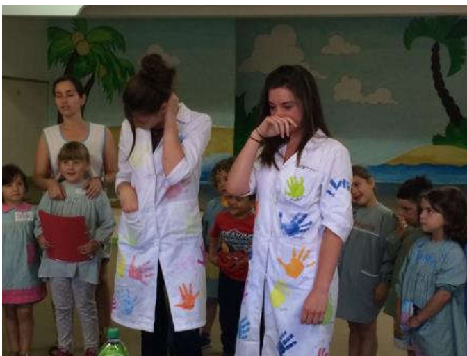
Avant leur départ, tous les enfants et les professionnels se sont réunis pour leur faire une surprise ! L'émotion est grande chez nos deux jeunes lycéennes...