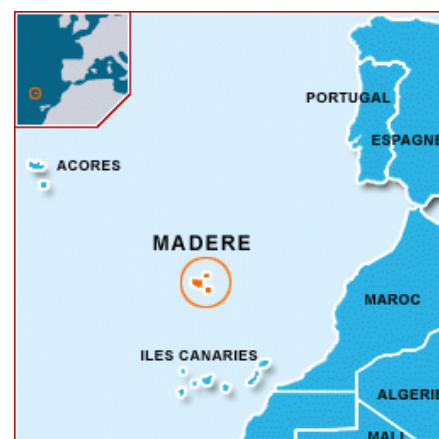
L'île de Madère